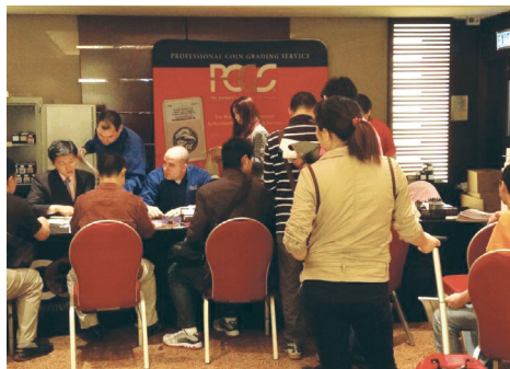
Der PCGS-Stand war während der Hong Kong International Coin Convention & Antique Watch Fair im April 2012 gut besucht. .

Das silberne Tengtian-Tael aus dem Jahr 1903 wird im maßgeblichen Münzkatalog, dem Illustrated Catalog of Chinese Gold & Silver , von Lin Gwo Ming und Ma Tak Wo, als einzigartig aufgeführt.